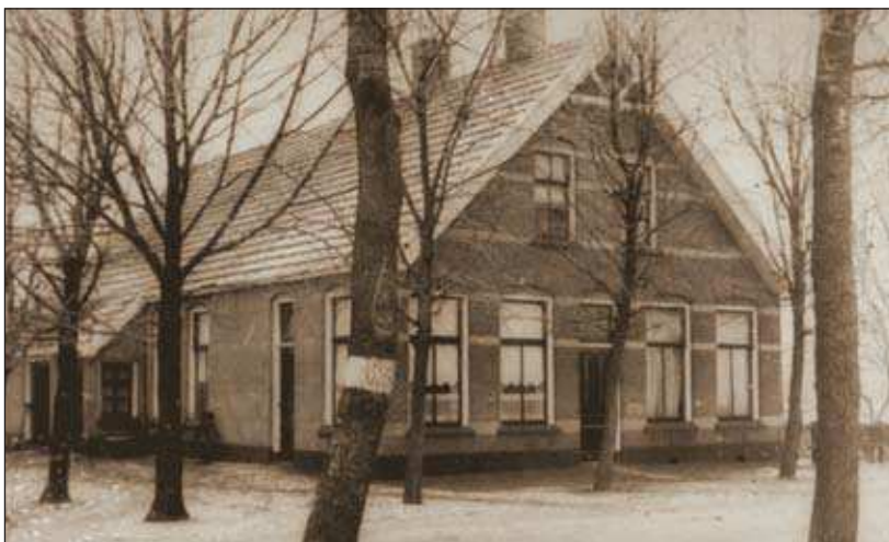
Prentbriefkaart uit 1915 van het enkele jaren eerder na brand herbouwde café in Baalder.