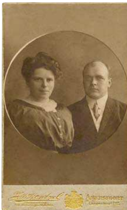
Het burgemeesters-echtpaar Groote Balderhaar ten Velde, geportretteerd door hoffotograaf J.W. Wentzel uit Amersfoort, ca. 1920.

termijn van vijf jaren benoemd. Die nieuwe ambtstermijn kon de burgemeester echter niet uitsdienen.