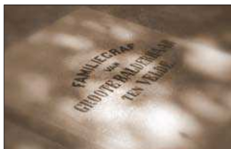
Deze grote stenen dekplaat sluit de toegang tot de grafkelder af. De namen van de bijgezette familieleden zijn niet vermeld, slechts 'Familiegraf van Groote Balderhaar ten Velde.'