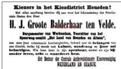
Deze oproep om toch vooral te gaan stemmen op de burgemeester, werd gepubliceerd in het Nieuwsblad voor Heusden en Altena, d.d. 6 maart 1912.