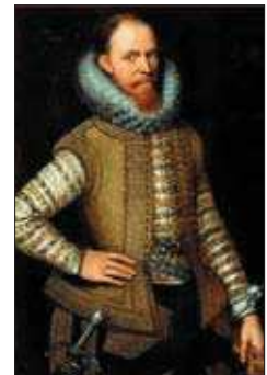
Het NAD-kamp bij Heemse droeg de erenaam Johan Maurits graaf van Nassau-Siegen.

De mannen van de Arbeidsdienst die in de kampen Heemse, Bergentheim en Gramsbergen verbleven, konden wekelijks in groepsverband gebruik maken van de Bad- en Zweminrichting 'de Marsch' in Hardenberg. De NAD had een contract met het bestuur van het zwembad afgesloten waaruit blijkt dat de jongemannen iedere zaterdag een paar uurtjes, van acht tot elf uur 's ochtends, gebruik mochten maken van de baden van de Marsch. De kosten bedroegen twaalf en een halve cent per manschap per keer. Tijdens genoemde uren was het bad gereserveerd voor de NAD en kon er verder niemand gebruik van maken. Saillant detail: het zwembadencomplex met het fraaie paviljoen was in 1934 aangelegd als werkverschaffingsproject.