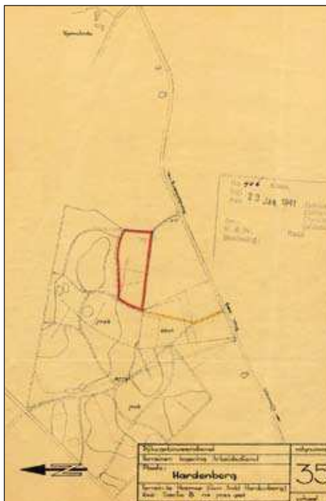
Het roodomlijnde gedeelte op dit kaartje betreft het terrein ten noorden van de Ommerweg waarop de barakken van de Nederlandsche Arbeidsdienst werden gebouwd, anno 1941.

‘Gij zult verbaasd zijn, dat ik mij met dezen aanhef tot u wend. Er is immers geen Nederlandsche weermacht en dus geen lichtung meer, waarin gij uw dienstplicht moet gaan vervullen. Ik kom echter op een geheel ander gebied een beroep op uw medewerking doen. Een gebied, waarin gij enerzijds veel zult kunnen leren ten nutte voor uw verder leven, anderzijds reeds aanstonds actief zult kunnen werken ten bate van uw vaderland. Sinds 15 mei 1940 zijn vele maanden verlopen. Maanden, waarin ons landje verder is meegesleurd in den groten maalstroom der beroeringen. Hoe zwaar de omstandigheden ook zijn, ons dierbaar vaderland mag en kan niet verloren gaan, indien een ieder zijn plicht blijft vervullen en alle Nederlanders er naar streven om eensgezind de moeilijkheden het hoofd te bieden. Veel zal in komende tijden van u gevergd worden, want gij behoort tot de jeugd op wier schouders de toekomst van Nederland voor een deel zal rusten. Gij zult daarom niet slechts moeten werken, gij zult moeten samenwerken, eendrachtig met vreugde en trots. Wilt gij leren, welk een kameraadschap deze samenwerking kan geven, hoeveel kracht daarvan kan uitgaan, hoeveel vreugde ook het eenvoudigste werk, gezamenlijk en ten nutte van uw land en volk verricht, u zal schenken? Wilt gij een gezamenlijk