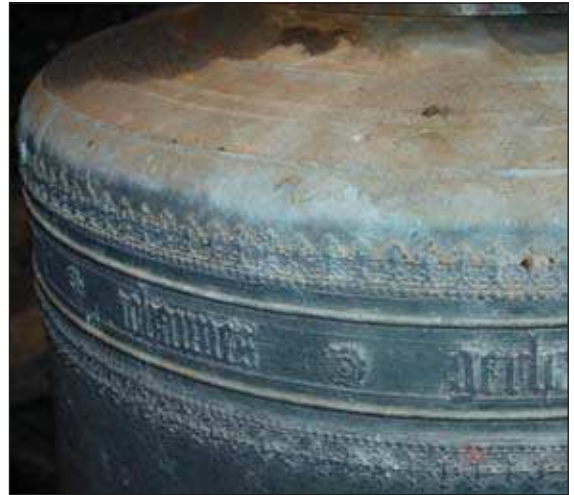
Gedeelten van het randschrift van de kleine mi-klok uit 1506.

Het was de Rijkscommissaris van Nederland, Seys-Inquart zelf, die in juli 1942 tijdens een van zijn redevoeringen zei: Gij weet, dat wij thans de kerkklokken wegnemen. Het luidde de volgende schanddaad van de Duitsers in: de klokkenroof. Van verschillende kanten werden