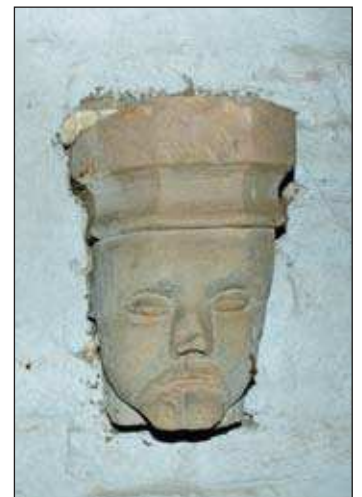
Bij de nieuwbouw in 1848 zijn in de kerktoeren, op elk van de vier hoeken, Middeleeuwse 'luistervinkjes' teruggeplaatst die zo goed als zeker afkomstig zijn uit de kerk die ter plaatse was afgebroken.