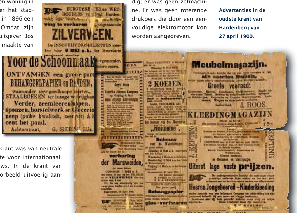
Advertenties in de oudste krant van Hardenberg van 27 april 1900.