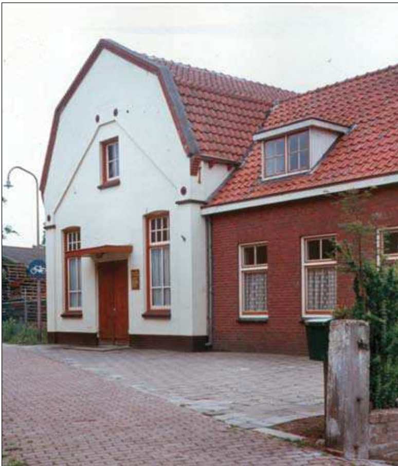
De bewaarschool kort voor de afbraak.