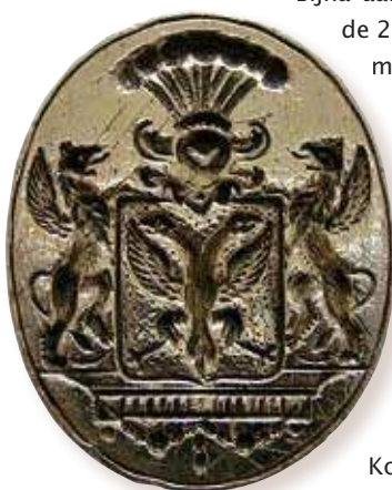
Zegelring met het familiewapen Van Riemsdijk.