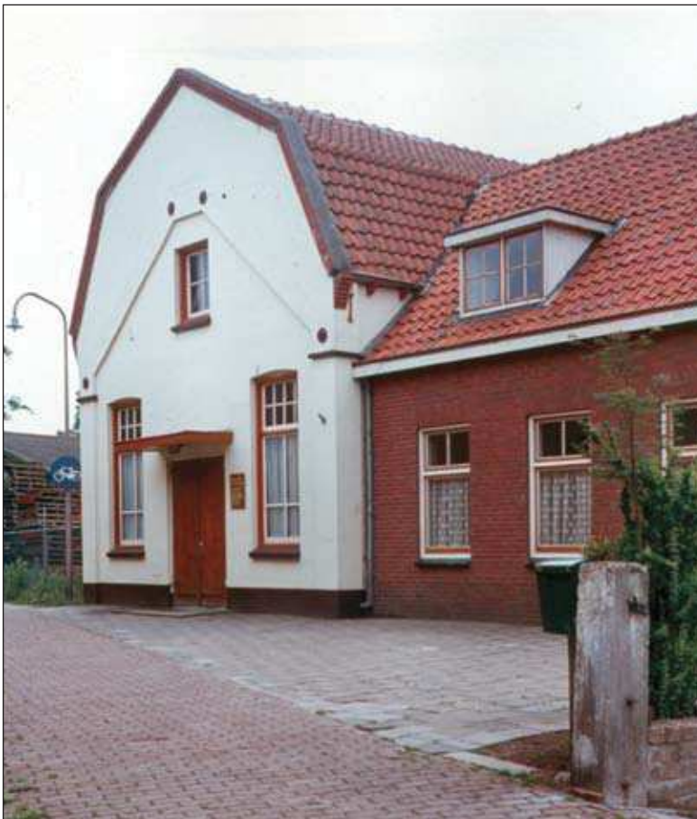
De bewaarschool kort voor de afbraak.