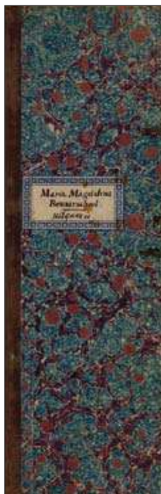
Kasboek van de Maria Magdalena Bewaarschool.

trok het leerlingenaantal weer wat aan en steeg wekelijks: naar 41 kleuters in mei.