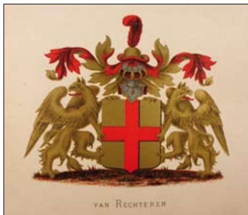
Het heraldisch wapen van het geslacht Van Rechteren.