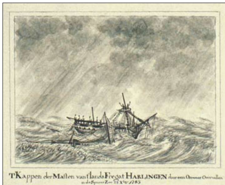
Tekening in gewassen Oost-Indische inkt, getiteld: 'Het kappen der masten van 't landsfregat Harlingen, door een onweer overvallen in de Spaanse Zee, 26 oktober 1783'. (Collectie Maritiem Museum Rotterdam)